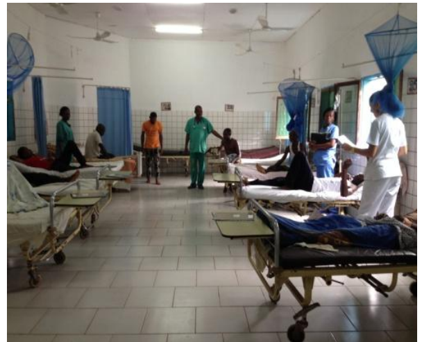
Sala de hospitalización