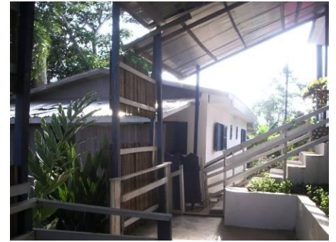
Casa de los voluntarios

Dentro del contexto general de Camerún, Kribi goza de ciertas comodidades: tiene infraestructuras que facilitan las comunicaciones (Douala está a 3 horas de coche por carretera asfaltada) y cuenta con servicios básicos (electricidad, agua corriente, comercios, restaurantes, transportes, bancos....sin olvidar las playas que la han convertido en el centro turístico del país).