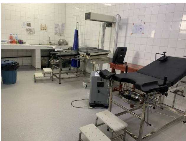
Sala de partos