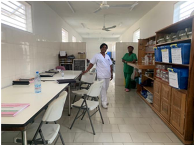
Sala de urgencias