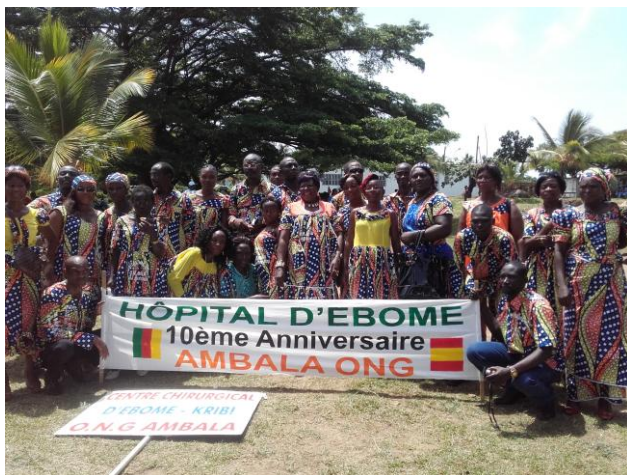
Parte del equipo celebrando el 10º Aniversario del Hospital en 2015

Además de esta plantilla fija están los voluntarios . La Coordinación de la ONG procura que el voluntario se integre en el equipo multidisciplinar y comparta su experiencia y buen hacer con el personal local para juntos poder atender las necesidades asistenciales básicas y también otras más específicas según el perfil del voluntario desplazado.