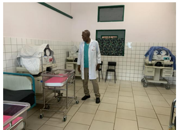
Sala de incubadoras